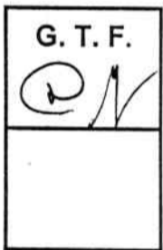
Raúl Horacio BERRONE Ministro de Economía Hacienda y Finanzas